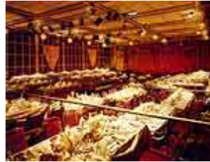
Die Verleihung im Festsaal