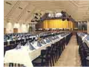
Bei der AfterShow Party

Multimediale Darstellungen sind auf Groß-Videowänden während der Show (Inserttafeln, Werbeschleifen vor Beginn und in der Programmpause) und über Screens / LED-Walls im Foyer und auf der V.I.P.-Party realisierbar.