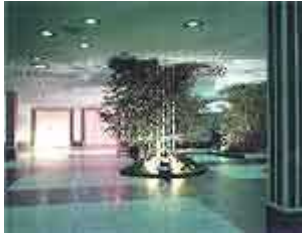
Für Aussteller und Partner das Foyer

Prints wie Einladungen, Tickets, Programmhefte, Flyer oder Anzeigen stehen ebenso zur Verfügung bzw. sind Teil von Sponsorenpaketen wie Banner- und Logoschaltungen im Internet oder Platzierungen von Produkten, Ständen, Werbetafeln, PKW-Beschriftungen, Displays, Plakate, Großpostern und Kleinwerbemitteln im Vorfeld der Veranstaltungen, vor der Halle, im Foyer und Saal sowie in den Räumen der Aftershow-Party. Ferner besteht für Fahrzeughersteller die Möglichkeit, sich im Rahmen des Shuttle-Service zu präsentieren.